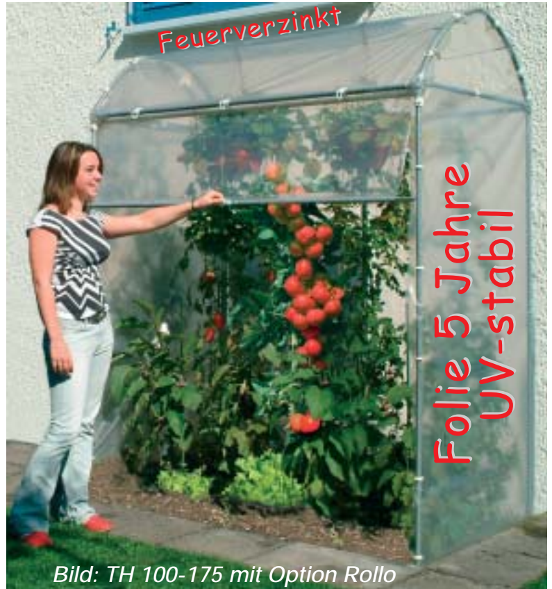
Bild: TH 100-175 mit Option Rollo